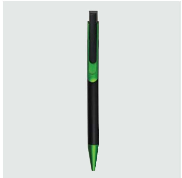
BOL 107 Bolígrafo Tintoretto