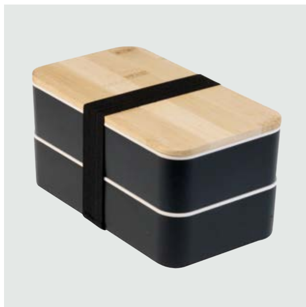
CAS 41 Doble Lunch Box Polaris