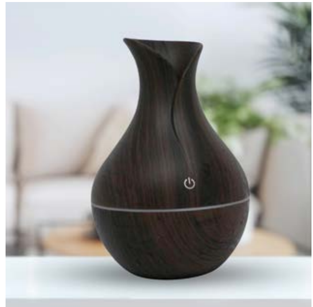
CAS 01 Vaporizador Contempo