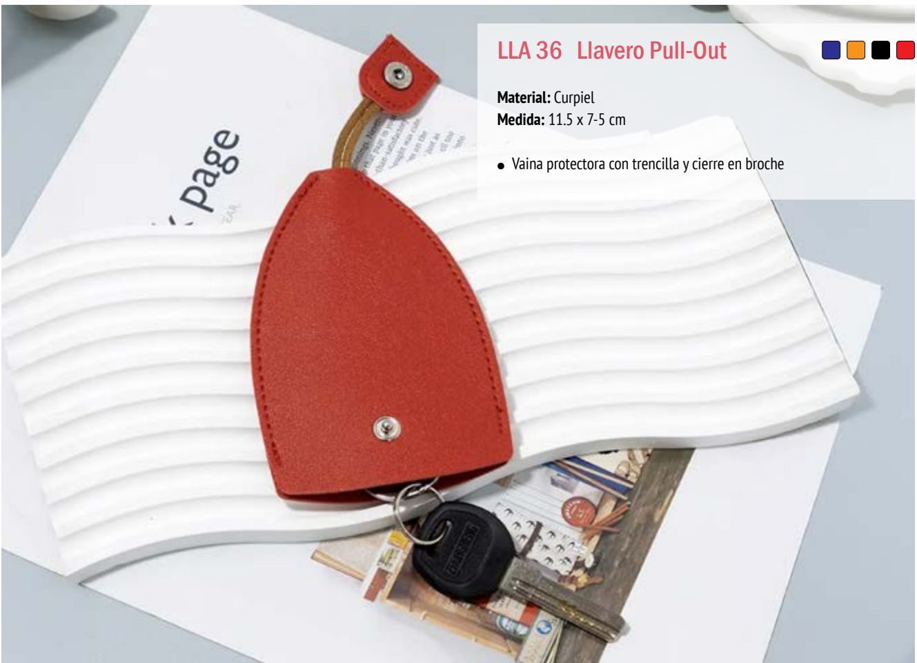
LLA 36 Llavero Pull-Out

Material: Metal y Curpiel Medida: 12.1 x 2.2 cm.