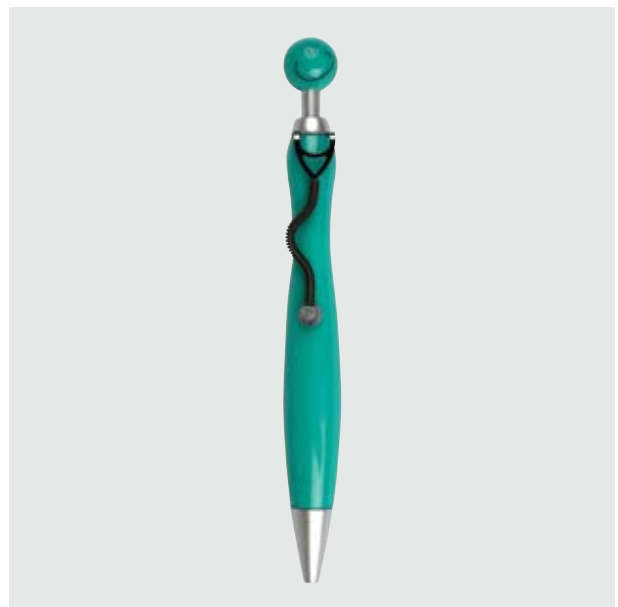
BOL 02 Bolígrafo Doctors

Material: Plástico Medida: 13.5 x 1.4 cm.