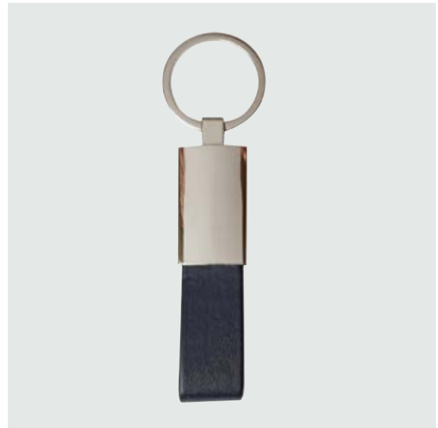
LLA 35 Llavero Rectangular Curpiel