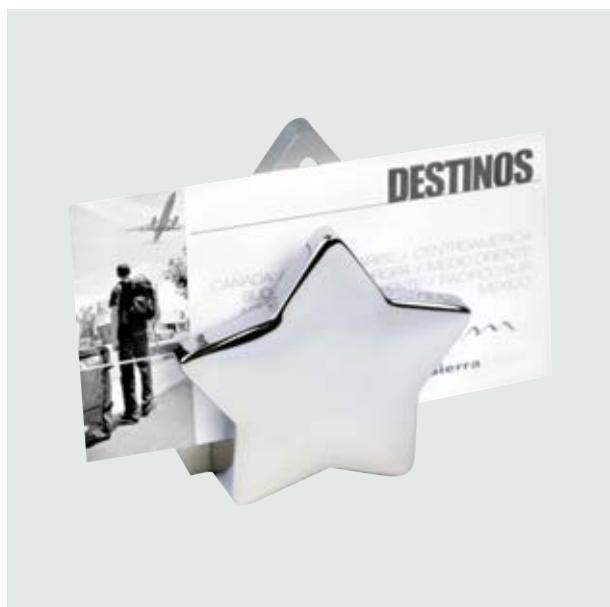
ESC 864 Porta Tarjetero Lyra